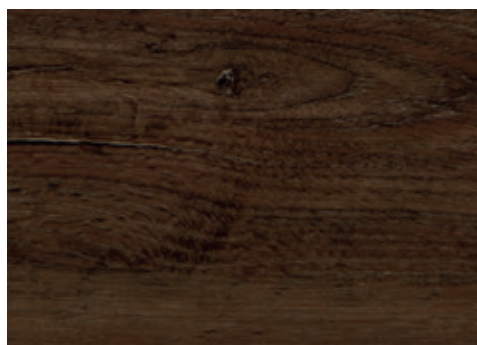
cod. H04/003168 Noce