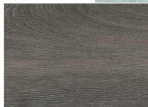
cod. H04/003282 Rovere Grigio