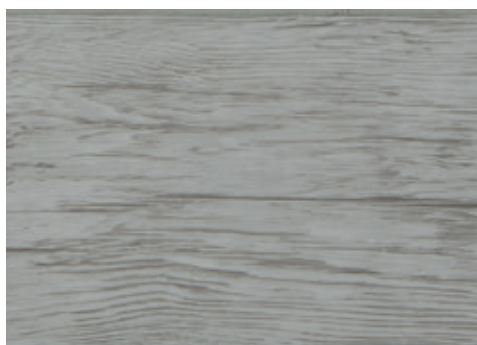
cod. H04/001148 Rovere Sbiancato