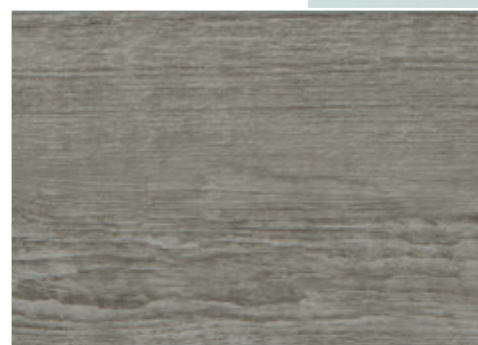
cod. H04/002478 Sbiancato Antico