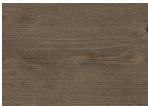
cod. H04/002482 Rovere