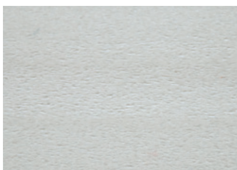
cod. A06/8600/556 Battiscopa Grigio