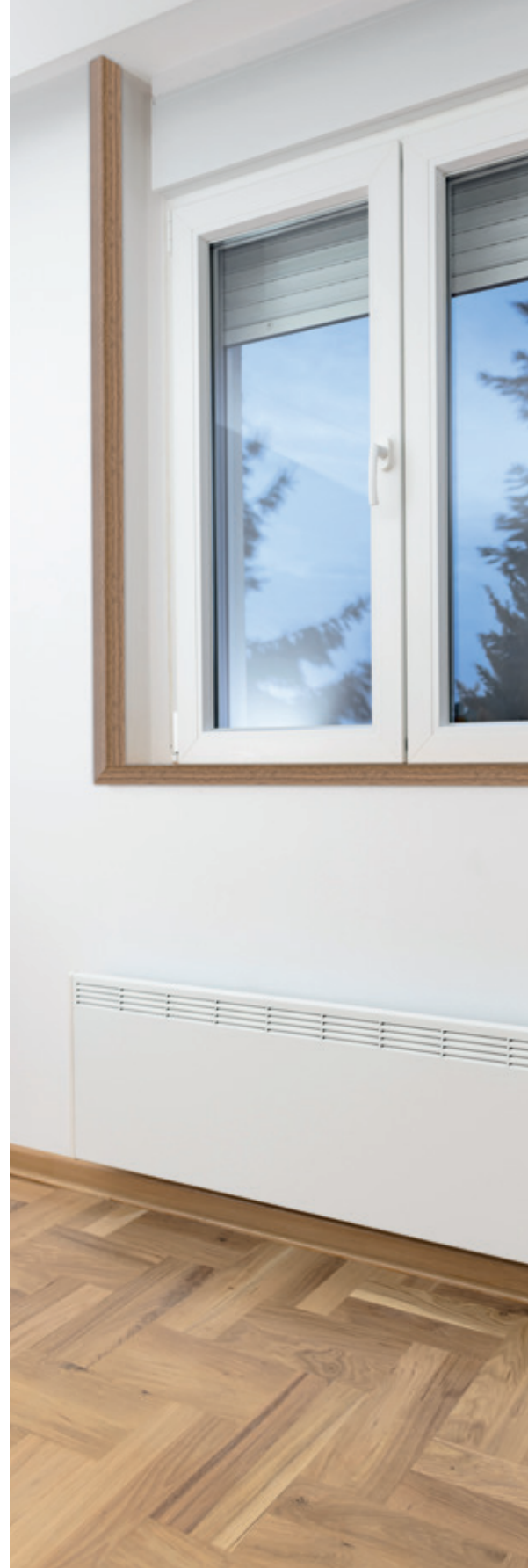
cod. A06/8611/557 Angolare Nero