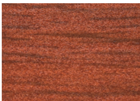
cod. A06/8600/542 Battiscopa Ciliegio