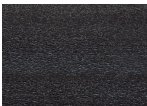
cod. A06/8600/557 Battiscopa Nero